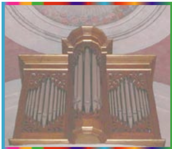
L'Organo della Pace

L' Organo della Pace , questo il suo nome, è uno strumento di notevole costo e di pregevole fattura fabbricato da Glauco Ghilardi, famoso organaro lucchese.