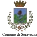
Comune di Seravezza